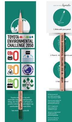
An example of a custom design.

Alle Sprout-Einzelkarten enthalten einen einzelnen Sprout-Bleistift. Die Einzelverpackung misst 211 mm x 54 mm Es gibt viele Möglichkeiten und wenige Einschränkungen: Die Vorderseite: Völlig kostenlos, damit Sie nach Belieben anpassen können. Die Rückseite: Alle Elemente sind fixiert, aber Sie können Farben und Schriftarten ändern.